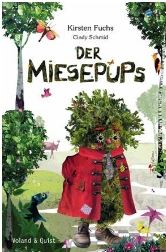
»Der Miese pups« von Kirsten Fuchs, illustriert von Cindy Schmid © 2016, Verlag Voland & Quist

Es wird vorgelesen: „Der Miese pups“ von Kirsten Fuchs und Cindy Schmid