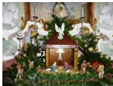
Krippe St. Cosmas und Damian in Unterwachingen

zichtbar! Aber auch für uns gläubige Christen sind Engel wichtige Boten Gottes, die sehr oft dann in Erscheinung treten, wenn es für uns Menschen wichtig wird. Und so war es als der Erzengel Gabriel, Maria die Nachricht überbrachte, dass sie die Mutter des Gottessohnes werden solle. Durch ihr bedingungsloses „Ja“ zum Heilsplan Gottes dürfen wir schon seit über 2000 Jahre, immer jedes Jahr erneut, das Weihnachtsfest feiern und in der Heiligabend-Liturgie in das „Gloria in excelsis Deo“ (Lk 2,14: „Ehre sei Gott in der Höhe“) des himmlischen Heers mit einstimmen. So wie man es auch auf dem Banner des Engels von St. Cosmas und Damian in Unterwachingen sieht. Die Geistwesen sind nicht nur damals den Menschen in der Bibel erschienen, die Gestalt der Engel findet sich in fast allen Religionen der Geschichte. Damals wie heute gibt es sie und manchmal dürfen wir Menschen in diese Rolle schlüpfen und für andere Menschen ein Bote des Schutzes und der Hilfe sein.