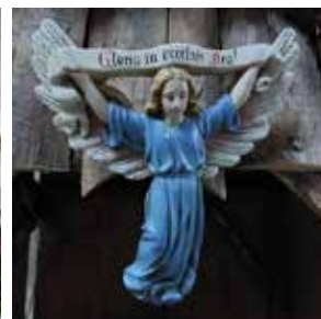
Krippenengel in der Grundschule Christoph-von-Schmid-Schule, Oberstadion 2024

Wir wünschen Ihnen und Ihren Familien von Herzen Frohe Weihnachten und ein gesegnetes Neues Jahr 2025.