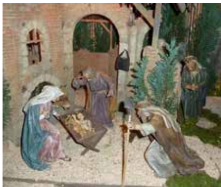
Krippe in der Pfarrkirche Oberstadion

Liebe Schwestern und Brüder in unserer Seelsorgeeinheit Donau-Winkel!