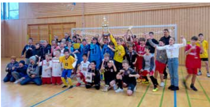
Die Teilnehmer des Munderkinger Stadtpokalturniers

Die Siegerehrung, durchgeführt von Bürgermeister Schelkle, krönte die Veranstaltung. Strahlende Gesichter der Sieger, stolze Schüler und lobende Worte des Bürgermeisters bildeten den festlichen Abschluss eines gelungenen Turniertags. Das Ereignis wird sicherlich noch lange in Erinnerung bleiben.