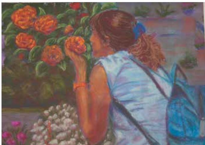
Pastellzeichnung © Frauke Wright.

Einen Zugang zum Haus des Landkreises in der Schillerstraße 30 erhalten Besucherinnen und Besucher in der Zeit von 10:30 bis 11:15 Uhr über den Eingang Schillerstraße oder den Innenhof. Die Ausstellung läuft bis zum 3. November 2023 und ist in dieser Zeit während der allgemeinen Öffnungszeiten des Landratsamtes zugänglich (Montag bis Freitag von 8:00 bis 12:30 Uhr sowie Donnerstag von 8:00 bis 17.30 Uhr).