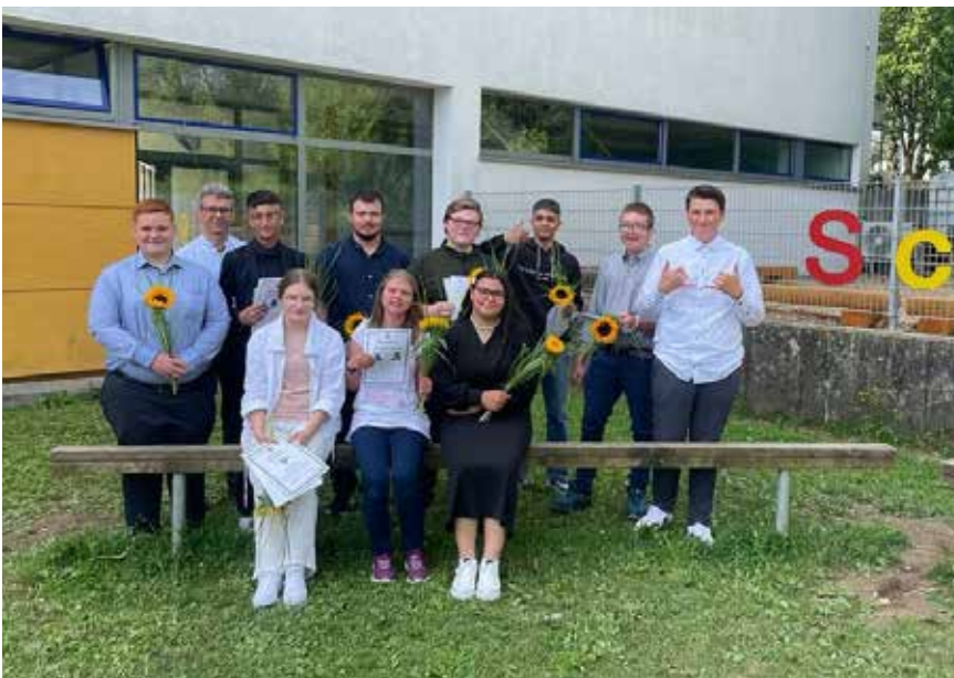
Die Neuntklässler des SBBZ Munderkingen verlassen die Schule.

Das Kollegium des SBBZ Munderkingen wünscht allen Schülerinnen und Schülern nochmals einen guten Start für ihre neuen Herausforderungen sowie alles Gute für ihre Zukunft!