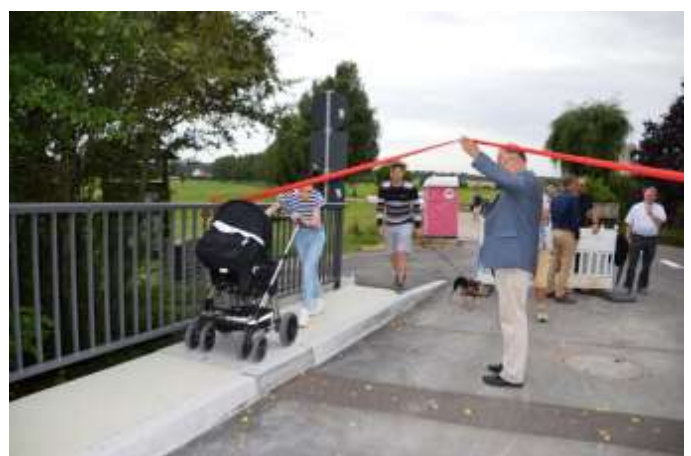
Verkehrsfreigabe Algershofer Brücke 2016