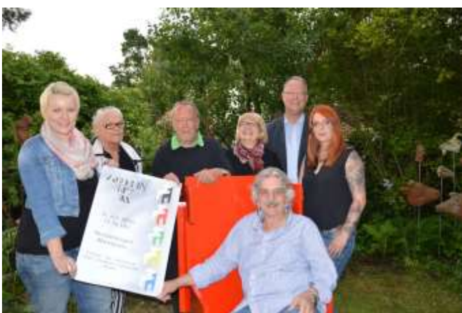
Modern Art 2015