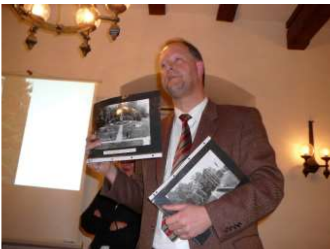
Vorstellung Bürgerpark 2008 (Bild Inge Burkhardt)