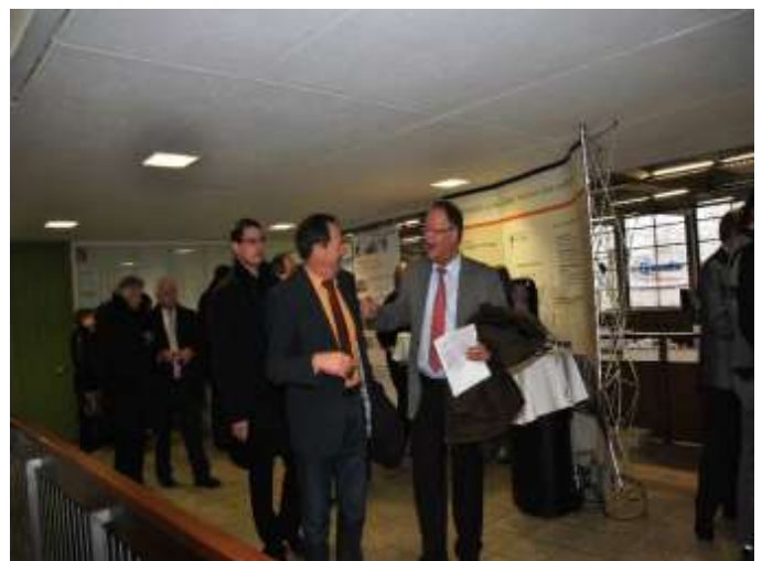
Regionaler Ausbildungstag 2012