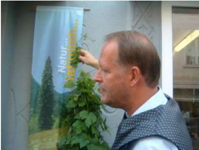
Hopfen 2007