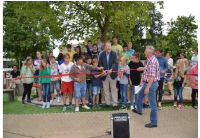
Einweihung Pauseninsel 2015