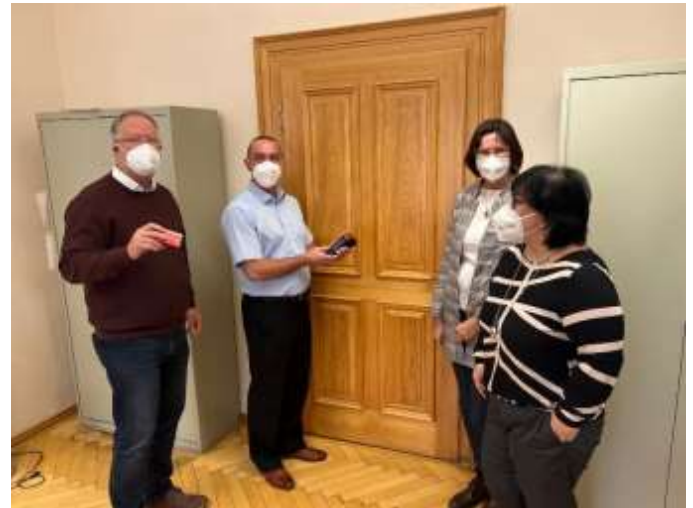
Einführung Kartenzahlung 2022