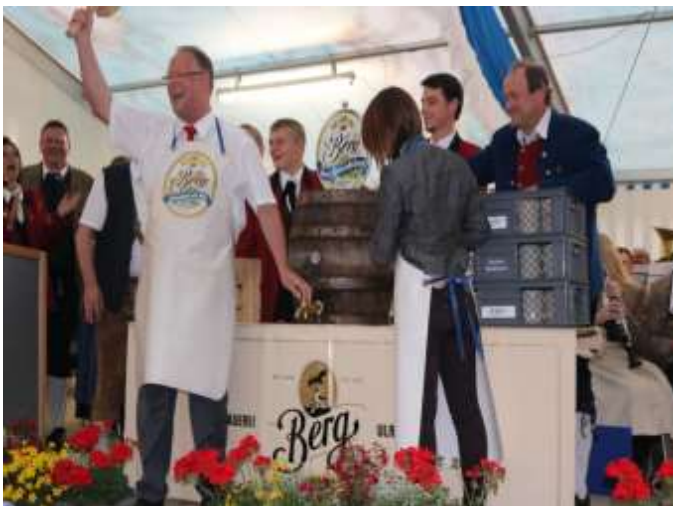
Fassanstich Sommerfest 2015