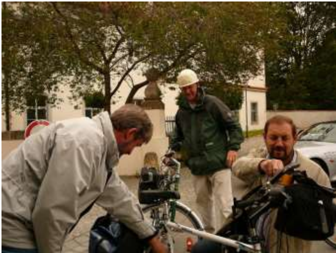
VG-Radtour 2007